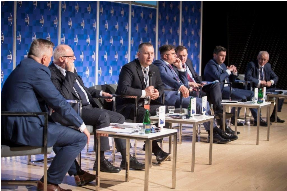
( https://cmsstatic.gkpge.pl/var/gkpge_site/storage/images/_aliases/galleryfull/0/1/0/9/269010-1-pol-PL/EKG_2.jpg )