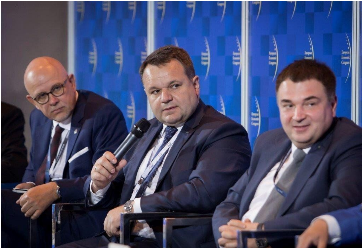
( https://cmsstatic.gkpge.pl/var/gkpge_site/storage/images/_aliases/galleryfull/2/2/0/9/269022-1-pol-PL/EKG_5.jpg )