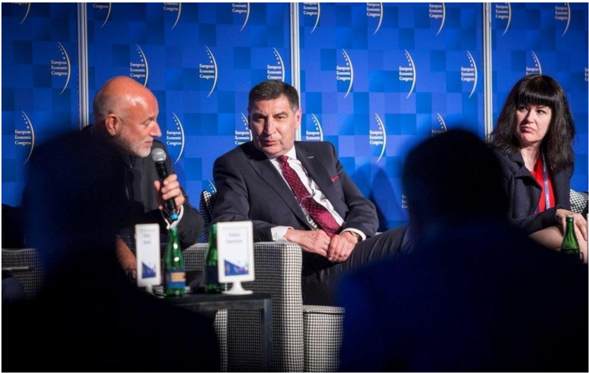
( https://cmsstatic.gkpge.pl/var/gkpge_site/storage/images/_aliases/galleryfull/8/1/0/9/269018-1-pol-PL/EKG_4.jpg )