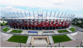
( https://cmsstatic.gkpge.pl/var/gkpge_site/storage/images/_aliases/galleryfull/6/0/0/9/139006-1-pol-PL/pgenarodowy_4.jpg )