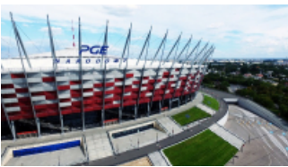
( https://cmsstatic.gkpge.pl/var/gkpge_site/storage/images/_aliases/galleryfull/2/1/0/9/139012-1-pol-PL/pgenarodowy_6.jpg )