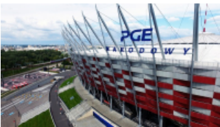
( https://cmsstatic.gkpge.pl/var/gkpge_site/storage/images/_aliases/galleryfull/8/1/0/9/139018-1-pol-PL/pgenarodowy_8.jpg )