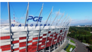
( https://cmsstatic.gkpge.pl/var/gkpge_site/storage/images/_aliases/galleryfull/4/2/0/9/139024-1-pol-PL/pgenarodowy_10.jpg )