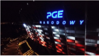
( https://cmsstatic.gkpge.pl/var/gkpge_site/storage/images/_aliases/galleryfull/9/0/0/9/139009-1-pol-PL/pgenarodowy_5.jpg )