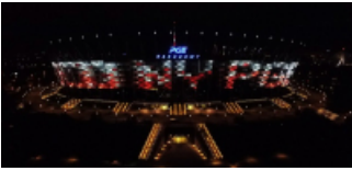
( https://cmsstatic.gkpge.pl/var/gkpge_site/storage/images/_aliases/galleryfull/3/0/0/9/139003-1-pol-PL/pgenarodowy_3.jpg )