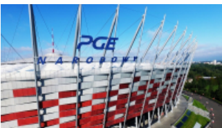
( https://cmsstatic.gkpge.pl/var/gkpge_site/storage/images/_aliases/galleryfull/5/1/0/9/139015-1-pol-PL/pgenarodowy_7.jpg )