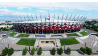
( https://cmsstatic.gkpge.pl/var/gkpge_site/storage/images/_aliases/galleryfull/1/2/0/9/139021-1-pol-PL/pgenarodowy_9.jpg )