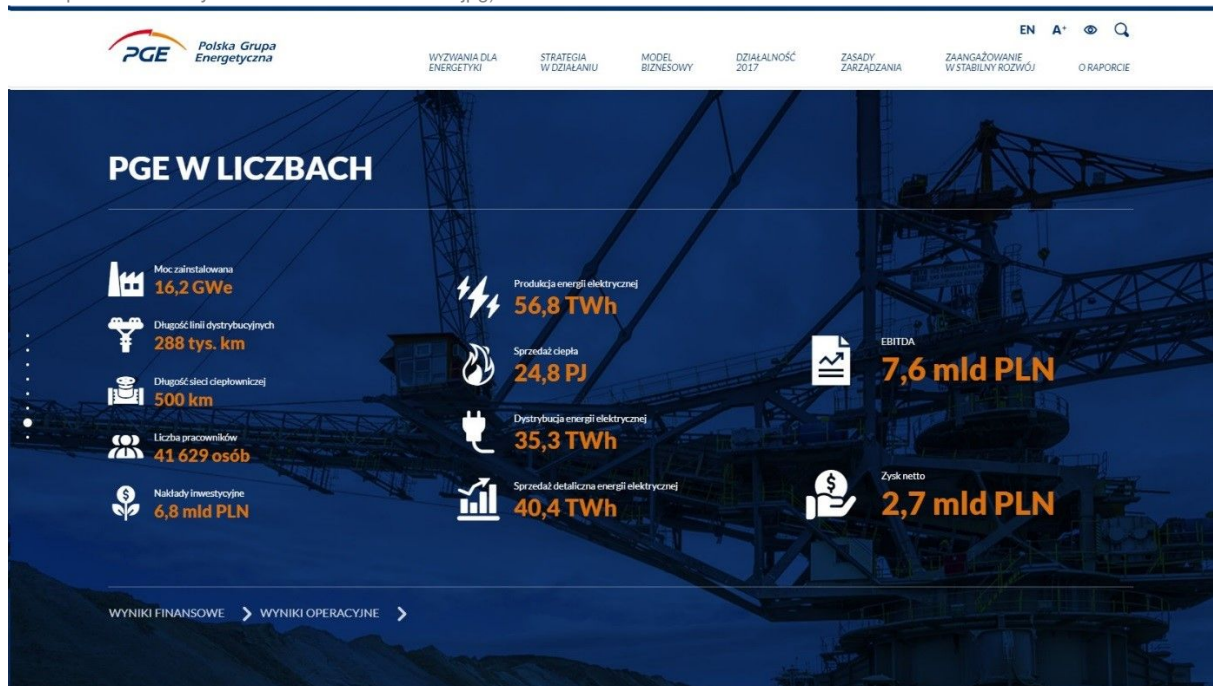
( https://cmsstatic.gkpge.pl/var/gkpge_site/storage/images/_aliases/galleryfull/6/3/5/5/295536-1-pol-PL/Grupa%20PGE%20w%20liczbach.jpg )